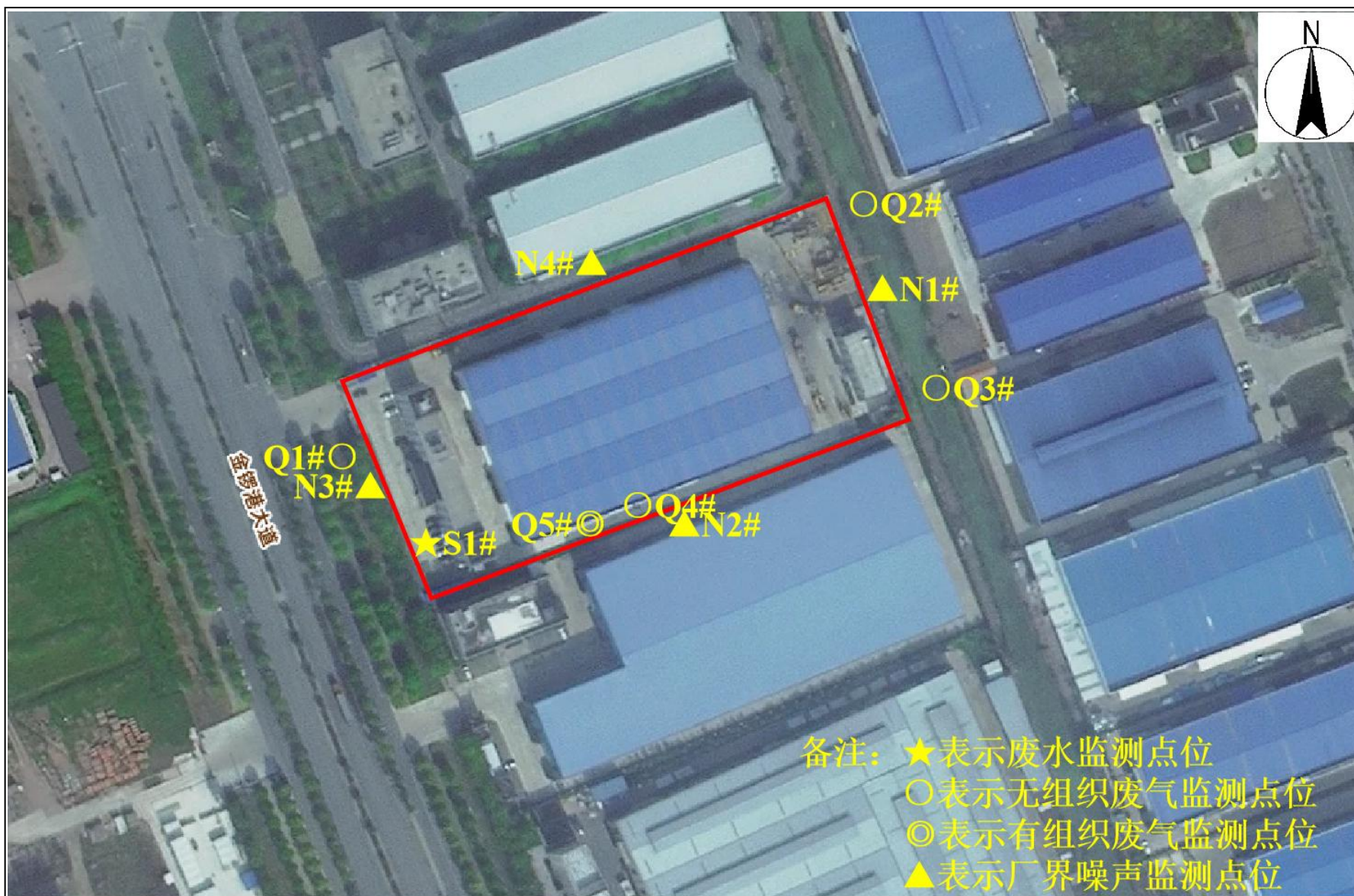
附图4 项目验收监测点位图