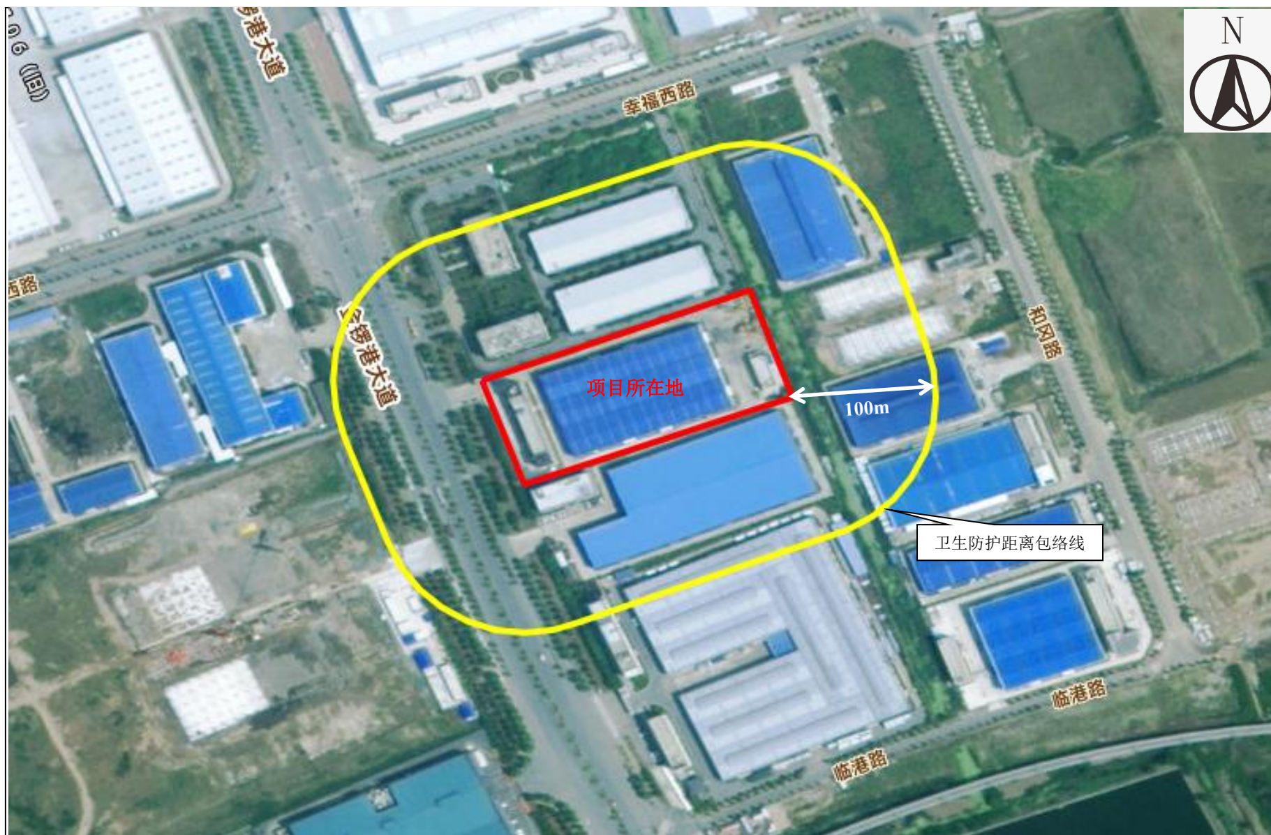
附图5 项目卫生防护距离包络线图