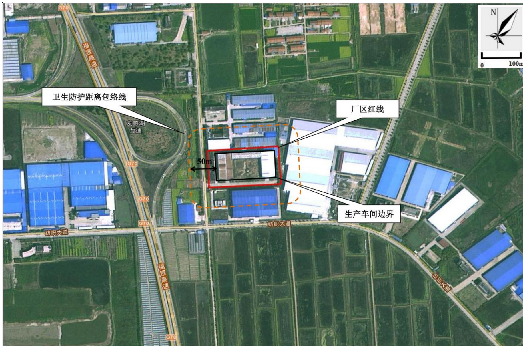
附图5 项目卫生防护距离包络线图