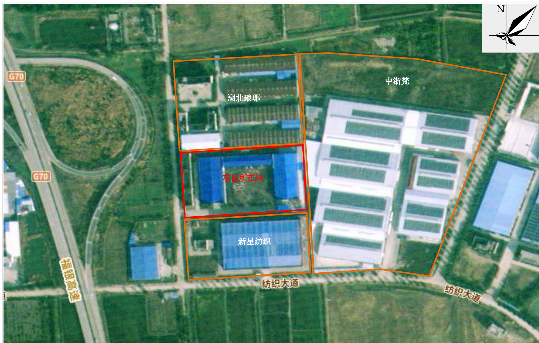
附图2 项目周边关系示意图