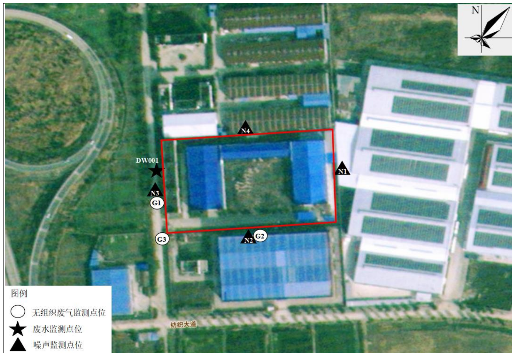
附图4 项目验收监测点位图