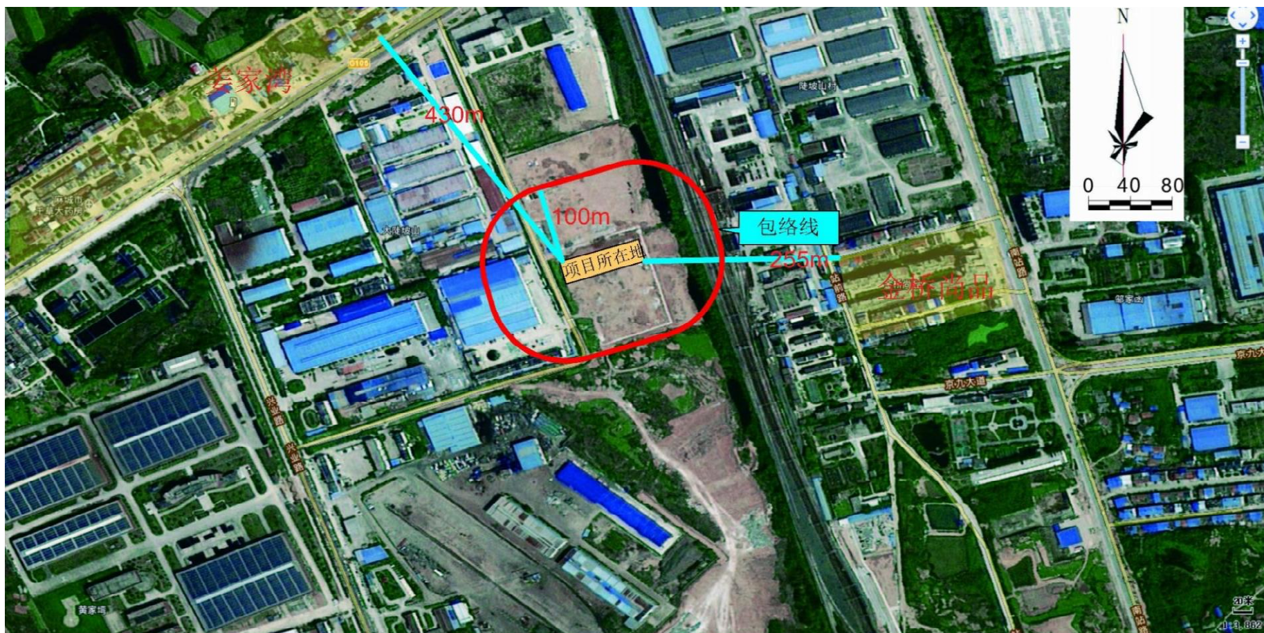
附图 4 项目卫生防护距离包络线图