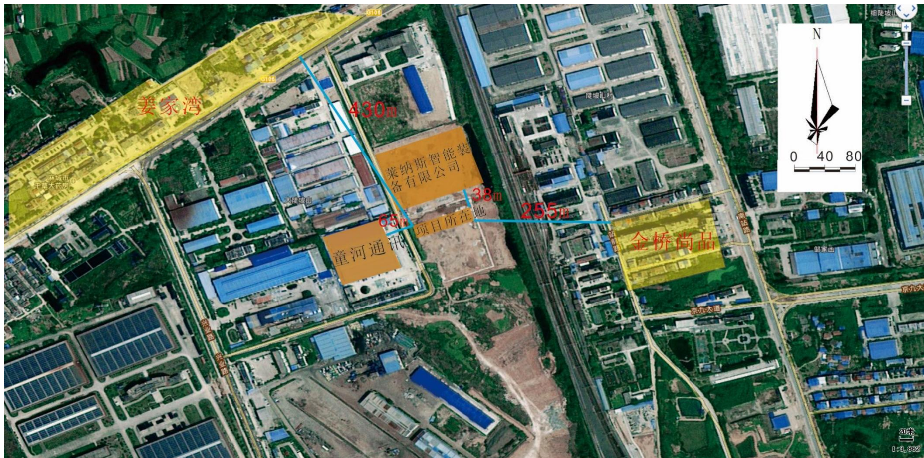
附图 2 项目周边环境示意图