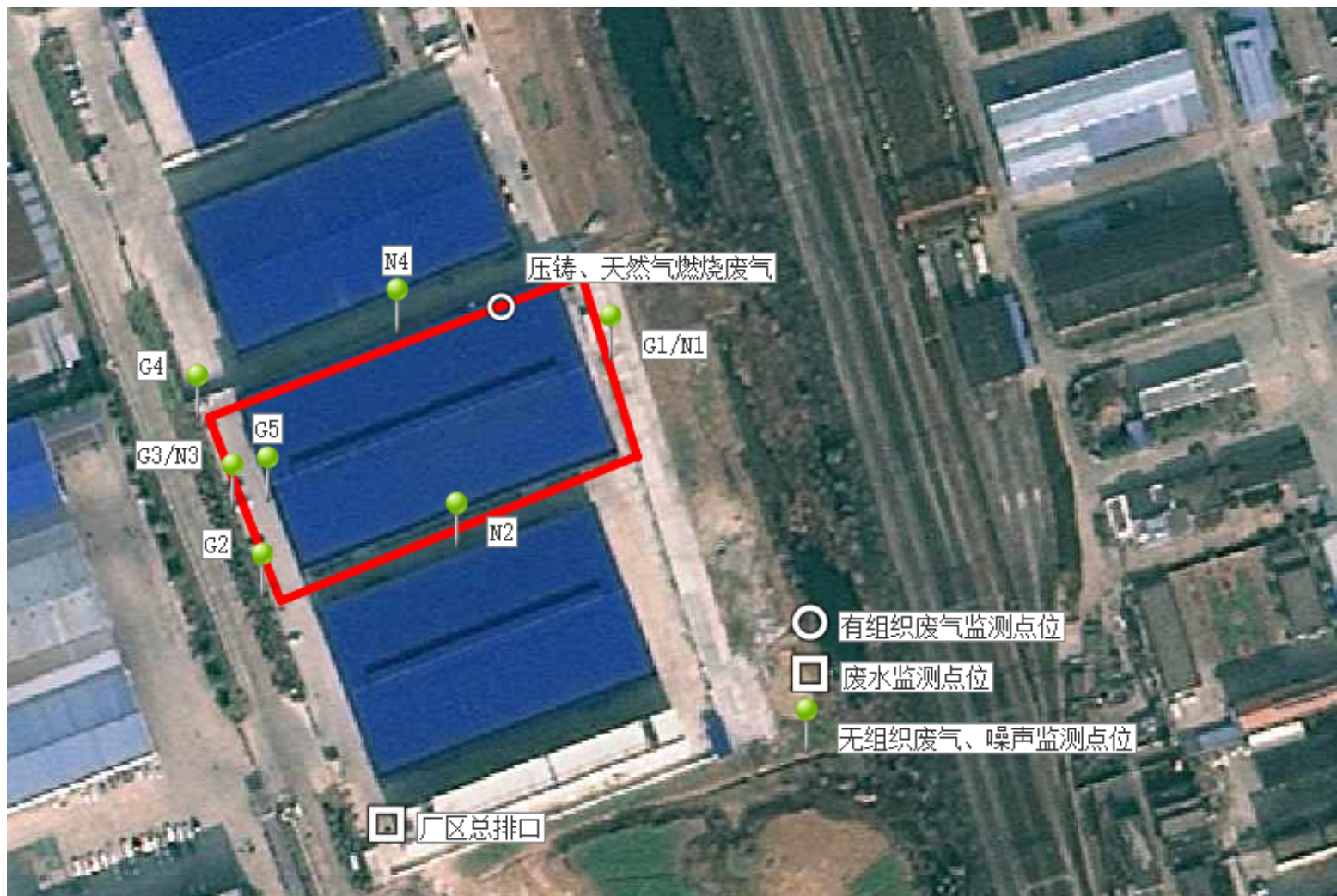
附图 5 验收监测点位图