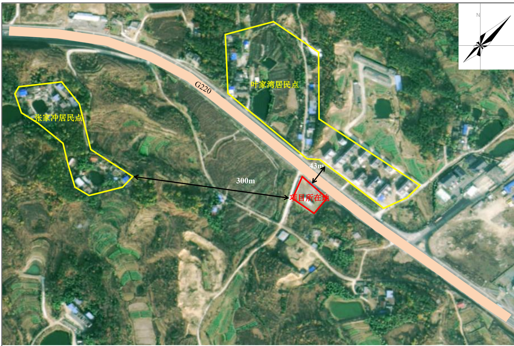
附图 2 项目周边关系示意图