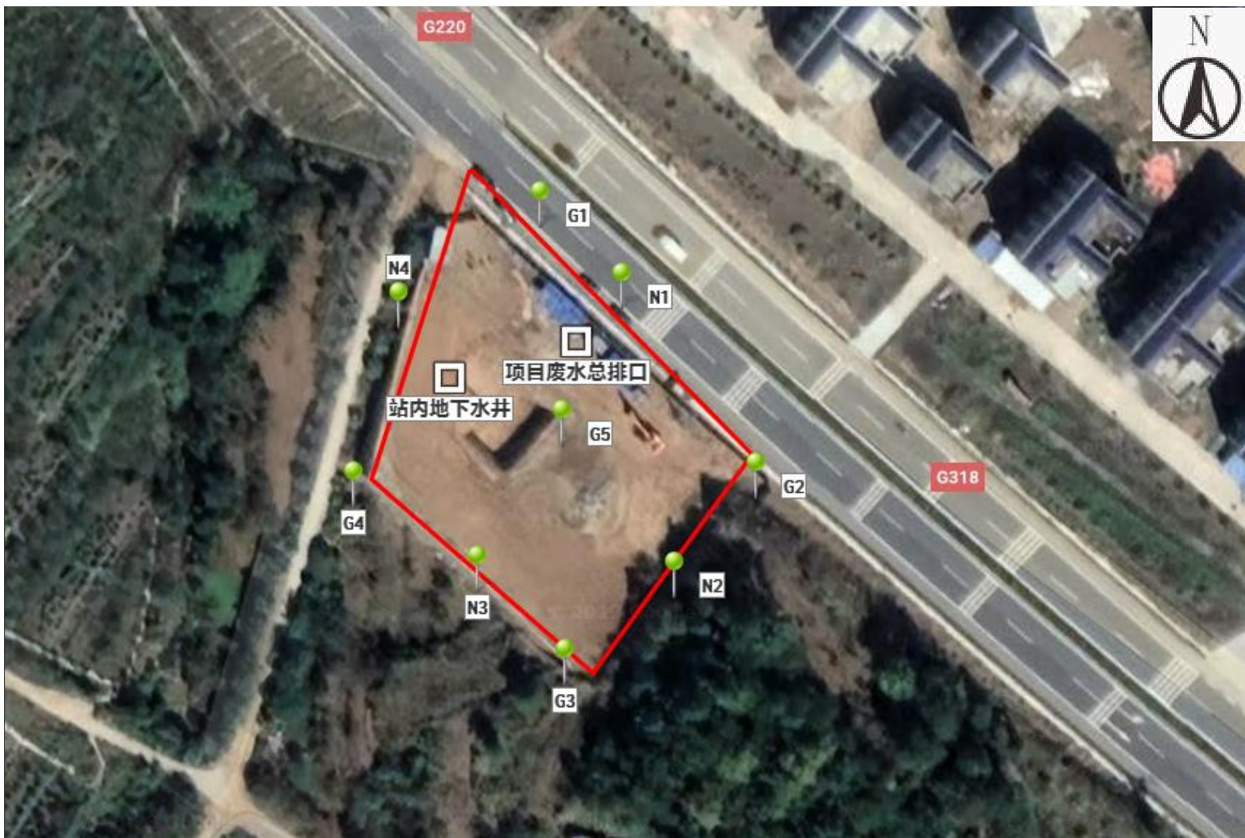
附图 4 项目监测点位图