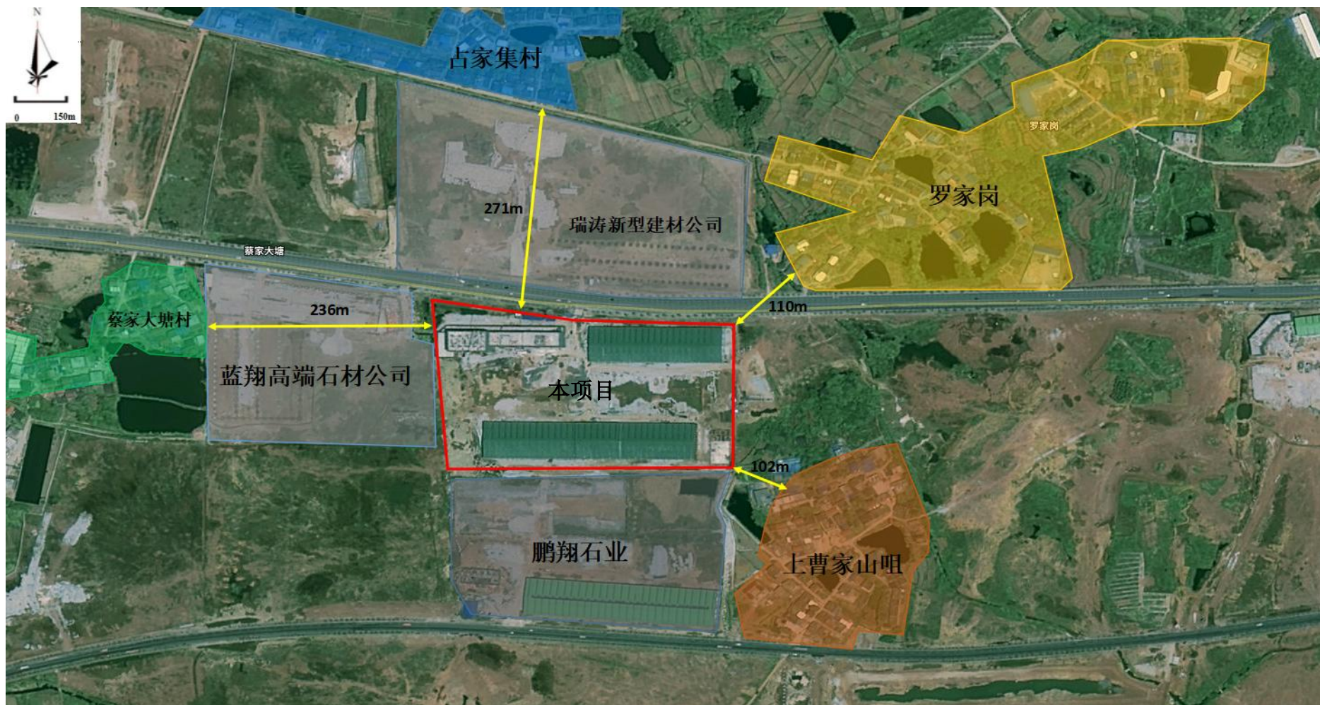
附图2 周边环境示意图