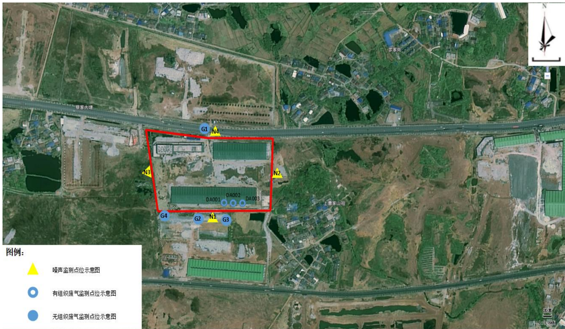
附图3 验收监测点位图