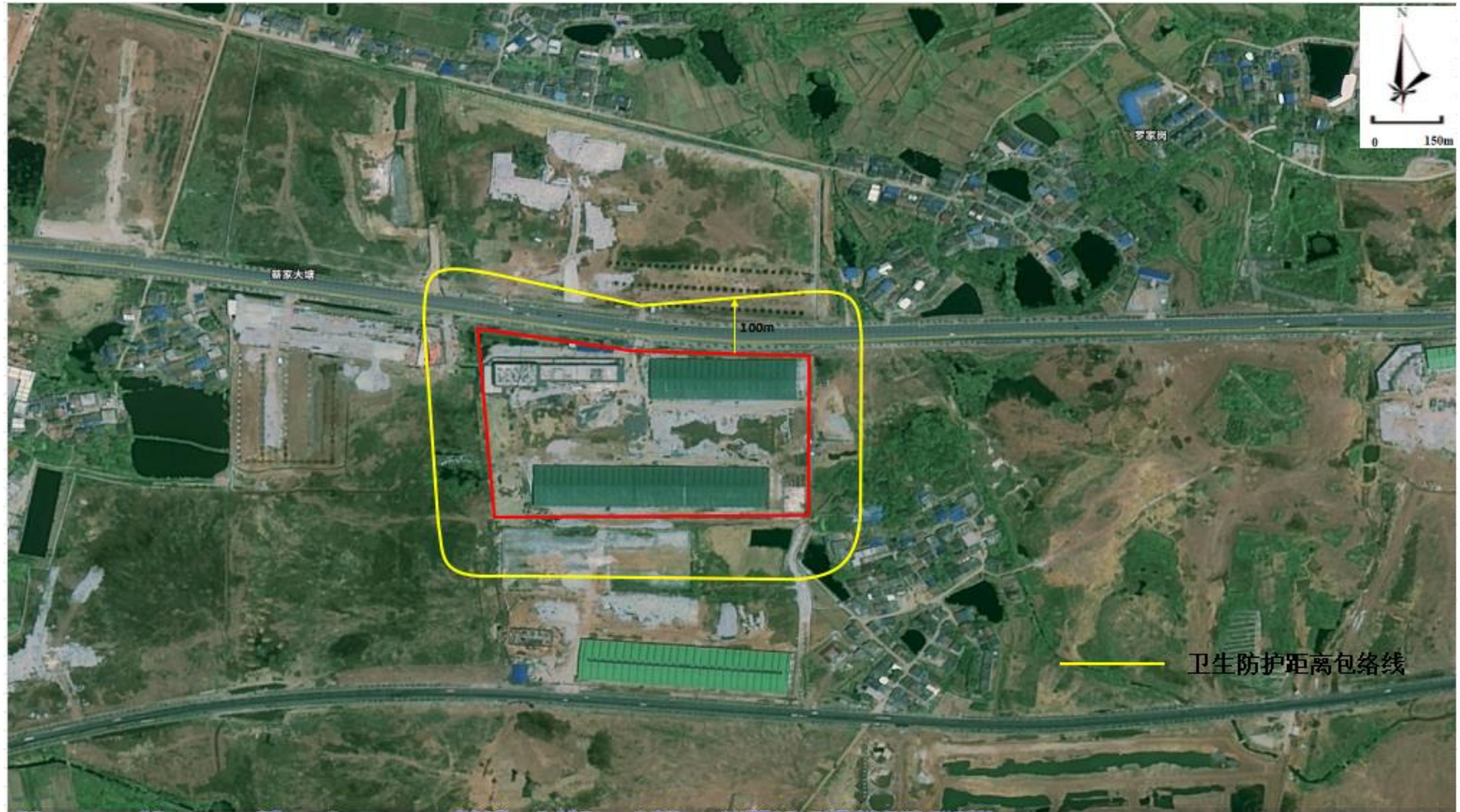
附图 5 卫生防护距离包络线图