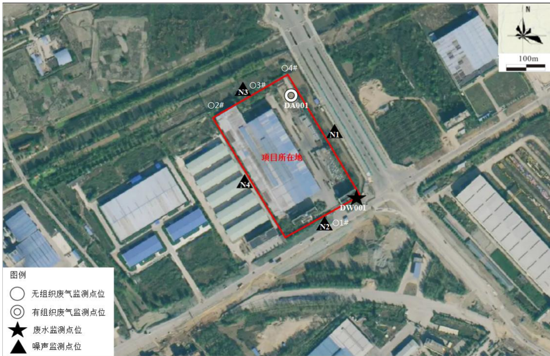
附图 4 项目监测点位图