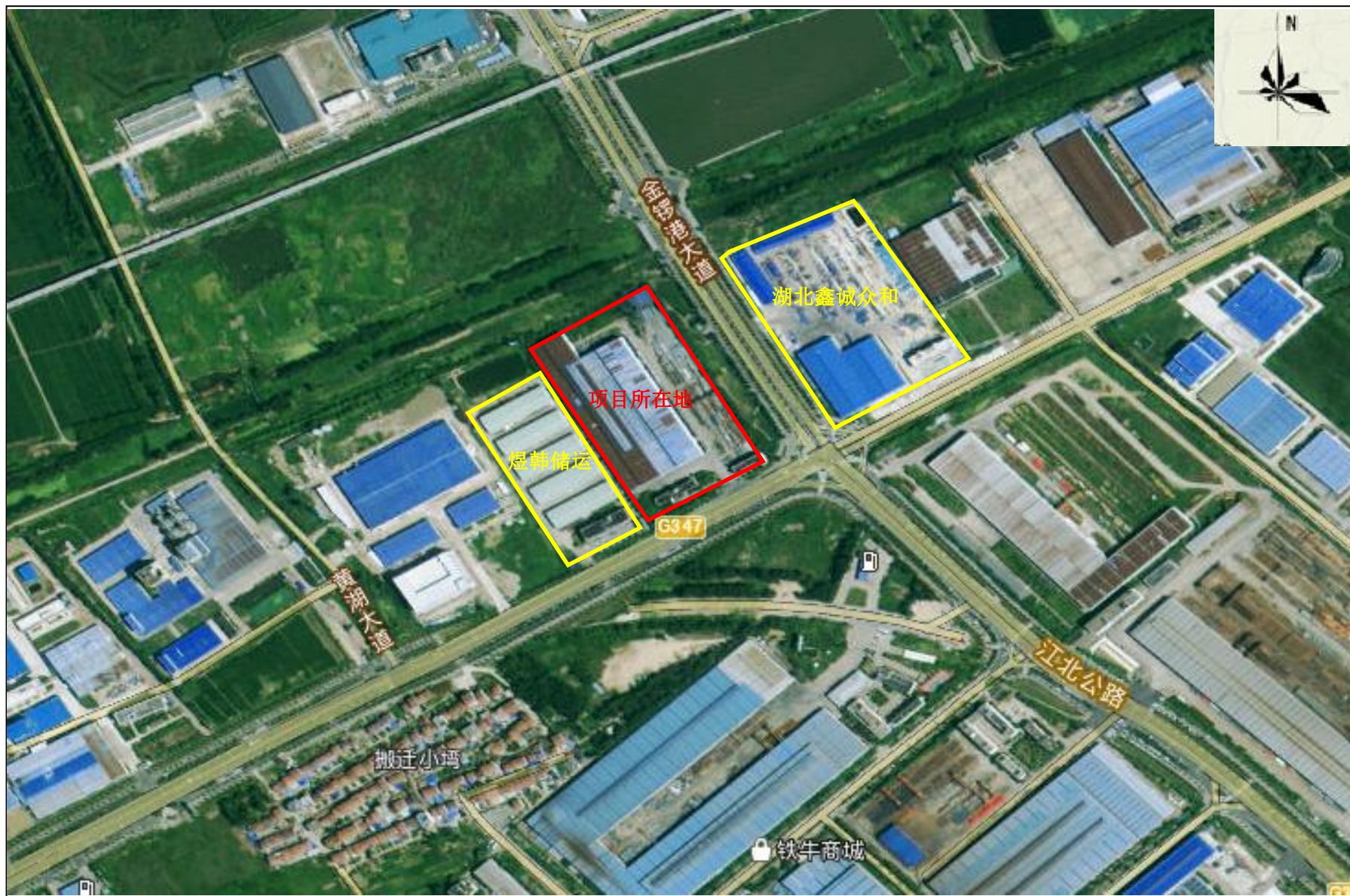
附图 2 项目周边关系示意图