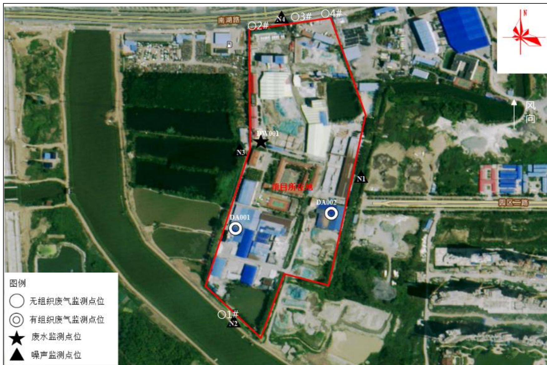
附图4 项目监测点位图