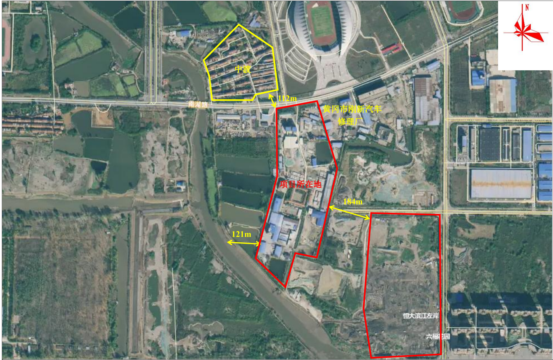
附图 2 项目周边关系示意图