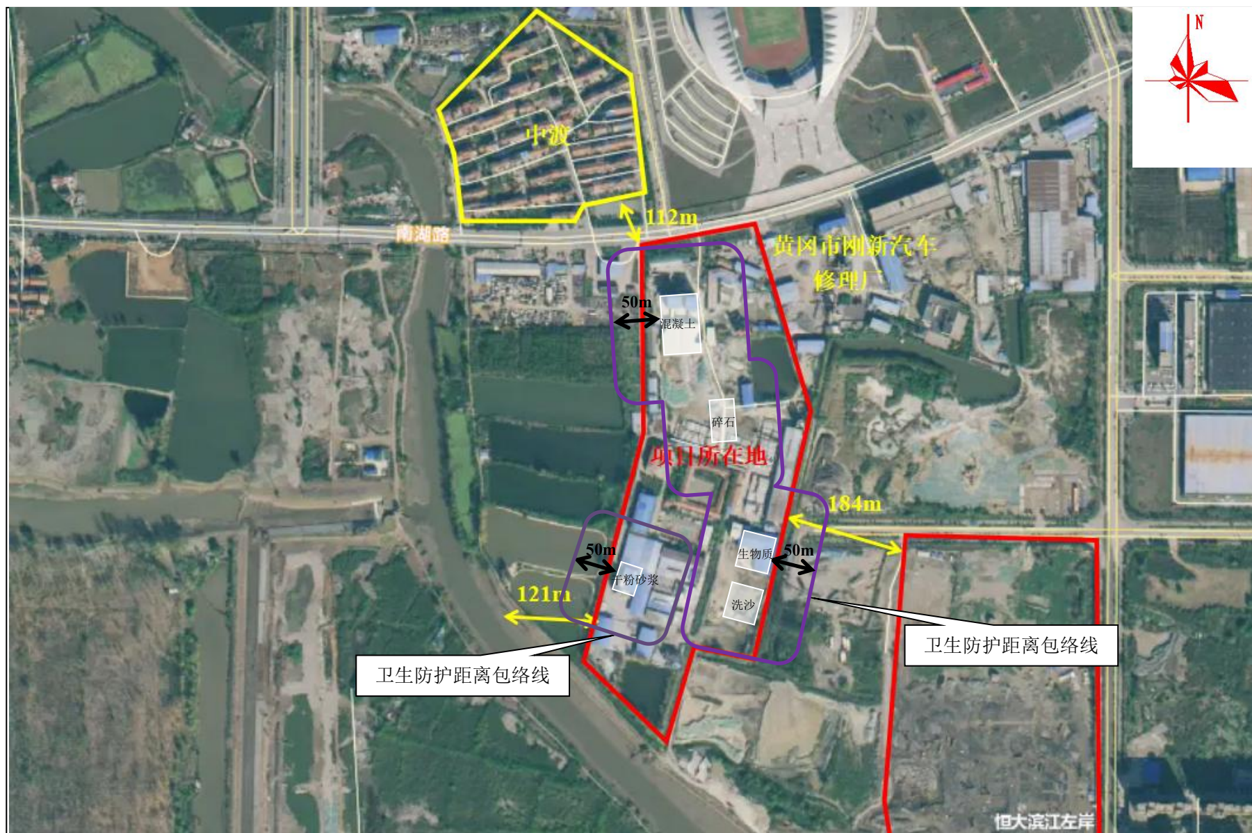
附图5 项目卫生防护距离包络线图